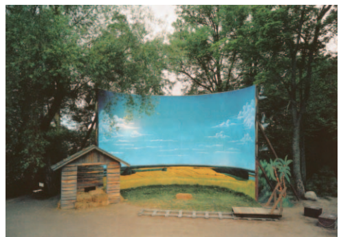
图17 Untitled (Systematic department II) , 2001-2002