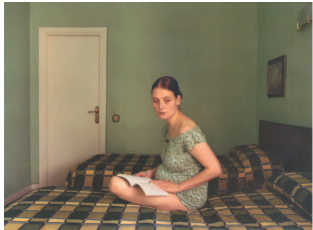
图13 Untitled (Green Room) , 2004