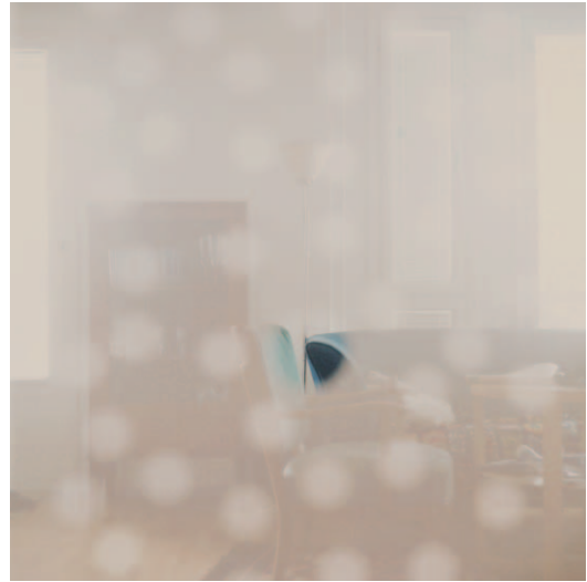
图11 Density , 2002