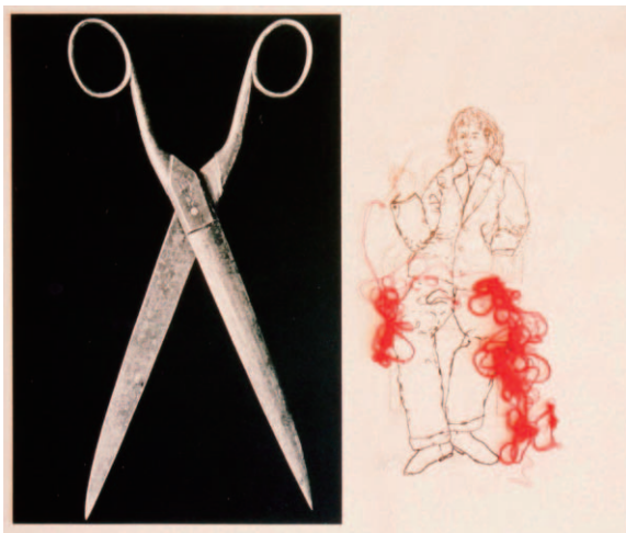
図8 Self portrait with scissors , 2004