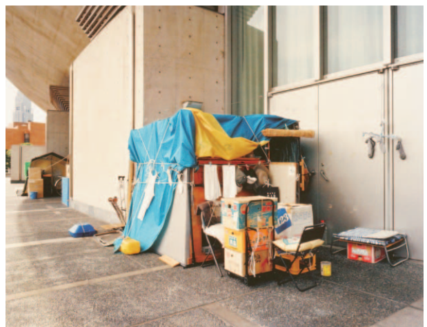
図9 Near Sendagaya Station (Tokyo #7) from IN SITE series, 2004