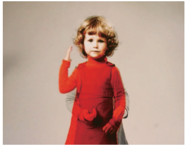
图15 Karlotta , 2003, video projection