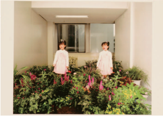
图20 Sad Tropical Fish , 2005