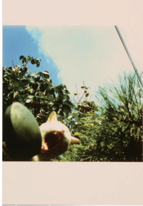
图21 from the series of Tentacles of Glance , 2007