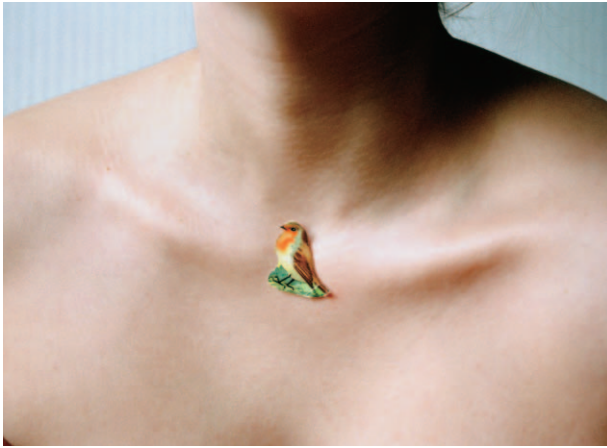
図3 from the series of Seedlings , 2004-2005