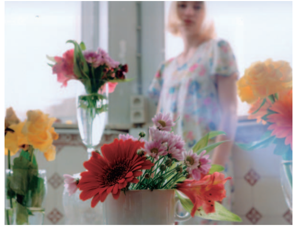
図4 from the series of The New Painting , 2001-2002