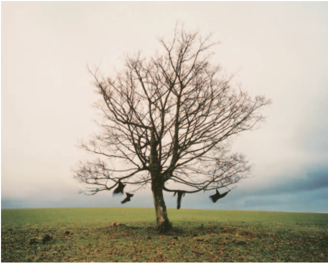
图10 Ravens , 2000