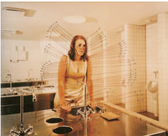
图12 57 Optional Spots to Crack the Bone , 2004