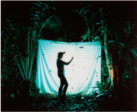
图14 Private Collection , 2003